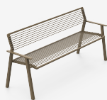
CORO METAL UM3D74